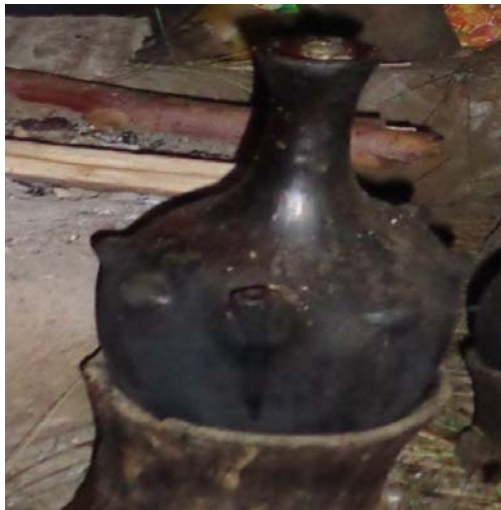
የአውዛ መቅጃ ባለጡት ጀበና