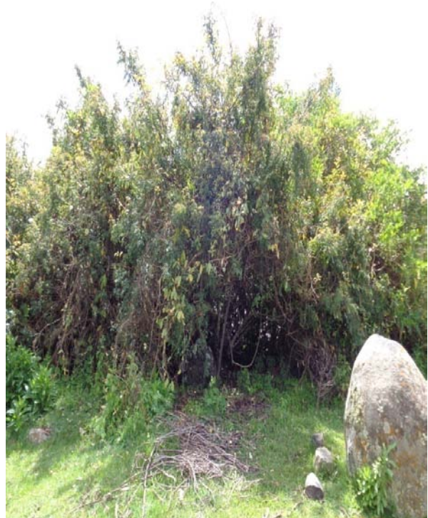
ምስል 4:- በድንጋይ ስር የሚከወን አድባር