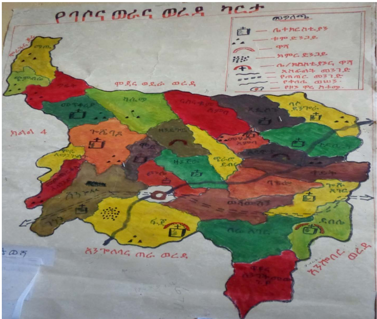
ካርታ 1:- ባሶና ወራና ወረዳ (በባሶና ወራና ወረዳ ባህልና ቱሪዝም ቢሮ የተዘጋጀ ካርታ፣ 2006 ዓ.ም.)

በጥናቱ ተተኪሪ የሆነው አካባቢ በአማራ ብሄራዊ ክልላዊ መንግስት በሰሜን ሸዋ ዞን ውስጥ በሚገኘው የባሶና ወራና ወረዳ ስር የሚተዳደረው የቀይት ንዑስ ወረዳ ነው። አቢይ (የባሶና ወራና) ወረዳው በስፋት 31 ቀበሌዎችን ይሟላል። ወረዳውን የሞጃና ወደራ፣ የሞረትና ጅሩ፣ የጣርማበር፣ የአንጎላላና ጠራ፣ የአንኮበር እና እንሳሮና ዋዩ በጥቅሉ ስድስት ወረዳዎች ያዋስኑታል።