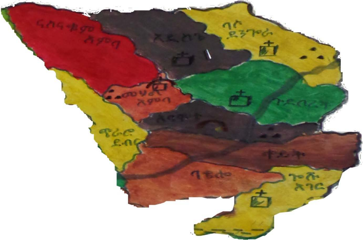
ካርታ 2:- ቀይት ንዑስ ወረዳ (በባሶና ወራና ወረዳ ባህልና ቱሪዝም ቢሮ የተዘጋጀ ካርታ፣ 2006 ዓ.ም.)

ናስና ቁም አምባ፣ አባሞቴ፣ ጎሹ አገርና ጭራሮ ደብር) ቀበሌዎች በንዑስ ወረዳነት ያገለግላል። ንዑስ ወረዳው ከ1989 ዓ.ም በፊት በነበረው አሰራር ወረዳ የነበረ ቢሆንም ከ1989 ዓ.ም በኋላ ግን በባሶና ወራና ወረዳ ስር ሆኖ በአቅራቢያው ለሚገኙ ከዚህ በላይ ለተዘረዘሩት ቀበሌዎች በንዑስ ወረዳነት እንዲያገለግል ተደርጓል። ከወረዳው መቀመጫ ደብረብርሃን በ17 ኪ.ሜ ርቀት ላይ የሚገኝ ሲሆን በአሁኑ ወቅትም ጤና ጣቢያ፣ ፖሊስ ጣቢያ፣ ትምህርት ቤት፣ ፍርድ ቤትና የመሳሰሉት አስተዳደራዊ ተቋማት ተሟልተውለት ተጠሪነቱን ለአቢይ ወረዳው በማድረግ የተለያዩ መንግስታዊ ግልጋሎቶችን በስሩ ለሚገኙት ቀበሌዎች እየሰጠ ይገኛል። በተጨማሪም በዚህ ንዑስ ወረዳ ስር የሚገኙት ቀበሌዎች የመንገድ፣ የንፁህ ውሃ፣ የመብራት፣ የአፀደ ህፃናትና የመጀመሪያ ደረጃ ትምህርት ቤቶች እና የትራስፖርት መሰረተ ልማቶችን እንዲሁም የጋራ መፀዳጃ ቤቶች በየአቅራቢያቸው እየተሟሉላቸው ነው (የባሶና ወራና ወረዳ ገንዘብና ኢኮኖሚ ጽህፈት ቤት፣ 2006ዓ.ም.)።