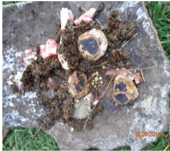
ለመናፍስቱ የሚሰጥ ግብር (ቦረንትቻ)