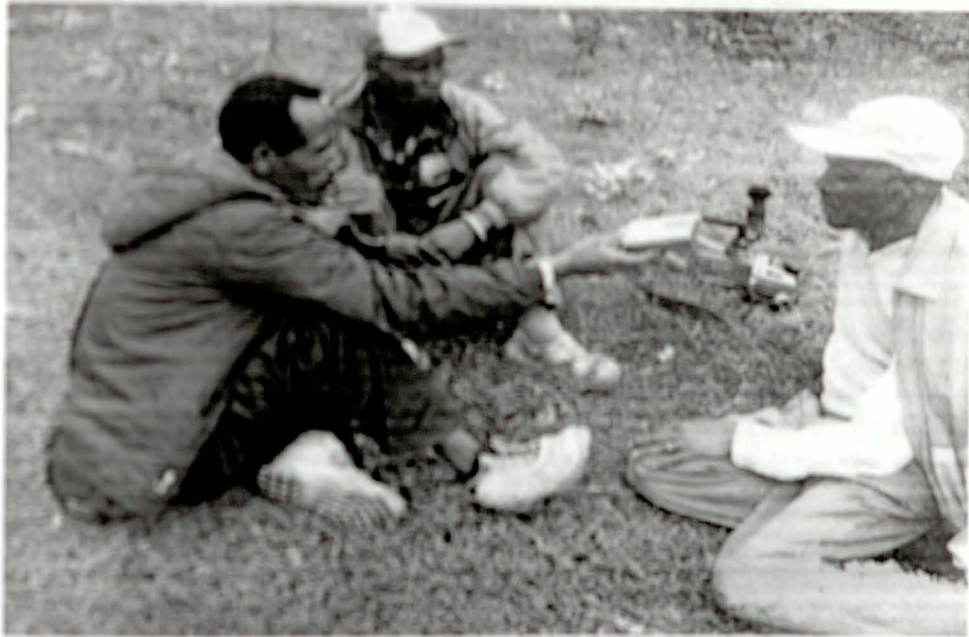
ቃልቻ አወቀ ፎርሽዋ በሙሉ እስተርጎግ ብርሃኑ ወርቁ በስተቀኝ

በመጨረሻም ቃልቻው ዝንጅብል ነስ ነስ እድርጎ ለረዳቱ ይሰጠዋል። ረዳቱም በተራው ዝንጅብሉን ነስ ነስ እድርጎ ለተረጋጋው ይሰጠዋል። ተረጋጋው ሰውዬም እንደ እነሱ ነስ ለተረ በመደቁ በሙሉ ይሰጣል። በመደቁ ከሀጻን እስከ አዋቂ ድረስ ዝንጅብል የመንከስ ሥርዓትን ይፈጽማል። በእነዚህ ለሌሎችም ዝንጅብሉ ትወሰድላቸዋል። ከዚያ በኋላ የቡና ቅጠል በተዘቃዛ ውሃ ሆኖ ይሰጣቸዋል። ቡናው መጀመሪያ ቃልቻው ፋት ካሉሰት በኋላ በቅል ተደርጎ እንደገና እድገት ተከተላቸው ለሌላትና ለሌላት ከዚያም ለመጀመሪያ ልጅ ተሰጥቶ ፋት ተት እያሉ በመቀጠል ይቃመሳሉ። ቡናና ዝንጅብሉ የተመረጠበትን ምክንያት ቃልቻው አወቀ ፎርሽዋ የግዚተላውን ባለዋል። "ቡና እና ዝንጅብሉ የተመረጠው ከጥንት አያቶቻችን ወይም ቃልቻዎች የተቀበልናቸው ነገሮች ናቸው። ዝንጅብል የሚሰጠው ሌላ ነገር ቢሰጥ ስለግጥራት ነው። የቡና ቅጠሉም ተዘቃዛ ውሃ ላይ ተጨምሮ የሚሰጠው ነገሩን ያጠርዳል። የተዘቃዘላችሁ ለግለት ነው።" 112