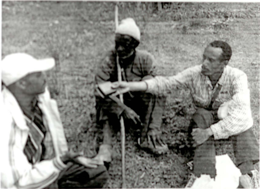
ሌትሮዋ ጠርገኑ ወርቅ በስተገራ፣ እንጀት እንባቢው ቃንግሪ ዶሪከረ በመሀል

ነው ከሆኑት ባለ ትናገራለች። 98 እንደሌሎቹ እምነት እውነቱን እውጥታ ባትናገርና ባሏ ቢሆን በተባሉ ሥጉ ሥርዓት ላይ በሚተጠቀሙ ከብት እንጀት ላይ በሚስቱ መባለግ ምገገናት እንደሆኑ በእንጀት እንባቢዎች ስለሚታወቅ ሌላ የግድያ ጣጣ ይዞም ስለሚመጣ ነው። 'ሌትሮዋ በሰውር ከውጭ ሰው ጋር ተገናኝታ ለባልዋ ምግብ የምትሰጥ ከሆነ ባልዋ ታሞ ይሆናል። ከዚያ ለሱ መቅባሪያ ከብት ሲተጠቀስ በምን እንደሞተ በዚያ ላይ ይታወቃል። ከዚያ የግድያ ወገን የሆነው ጎሳ ጠባብ ያገኛል። ግጭቶች ተፈጥረው ይጋደላሉ።' 99 ከዚህ ተጨማሪ ሌትሮዋ በትደባት በልጆቿ ፈንጠጣ ላይ ተርሳ የተባለ በሽታ ምልክት ሆኖ ስለሚወጣ ተጋለጧል። 'ሆትናገርበት 'የርሳ' የሚባል ነገር አለ። ከደባቶች የልጆች ፈንጠጣ ወደ ወጪ ይወጣል። ያ ሲታይ የሚባለው ይቺን ሲት ሌላ ደፍሯት ደብቃለች ይባላል። ለዚህ የተደረገች ሲት ለባሏ እኩል ደረጃ ባለ ትናገራለች።' 100