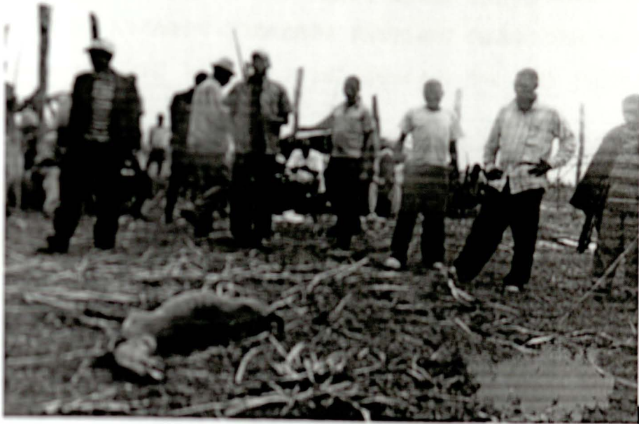
በድንጋይ ተተገኝው የተገደለው ከብት

መሀል እናቱን በድንጋይ ተመትቶ የተገደለው ቢሄ ሀራዶን ታርዶ ሥጋው ይበለታል። እንደቱን ጨምሮ የተለያዩ ክፍሎች ለሌሎች በመስጠት የወተት እንጀቱ ፈጥኖ ውስጡ ያለው ታላቅ እንዲጠባባይ ይደረጋል። እስከ አሁን ያገኘው የሥነ-ሥርዓቱ ለካሎች እየተከናወነ የገደለ ገጭ ይገኛል። ትንሽ ዱቄት ከገዳይ ቤተሰብ፣ ትንሽ ዱቄት ከሟች ቤተሰብ ተዋጥቶ ሁለት ገበር ተጥሎ ይገኛል። ሌት ከሆነች እርጊት የወር አበባ ማየት ያቆመች ወንድ ከሆነ እንደሆነው ወገኖቿ ሽግግሉ የሆነ ገጭን ያገኛል። በመካኒት ቤሐረሰብ የበቆሎ ገንፎ በወትረጥ የገባ ሲሆን ለሌላ እርት ቀን የሚዘጋጀው ገን የማሽላ ገንፎ ነው። ይህ የሆነበት የኑወ የገባቸው በቆሎ እንደ ባቻ ፍሬዎቹን አባትሎ ስለሚቆምና ዳገመኛ ፍሬውን በገንዳ ላይ ስለገይሰጥ እንደ ኖሮ የገለጻን ያስጠር ስለሚገልጽ ነው። በተቃራኒው ማሽላ ገን ስለሚጠር ዘርፍ ከእንደ ወላይ ፍሬውን የሚሰጥ ስለሆነ የዳገም ውልደት ምሳሌ ወይም ዳገም ዘር የመተጠል ያስጠርን ስለሚገልጽ ነው። ግሽላን ከሟች ጋ በማመሳሰል፣ የሟችን ሞቶ እውነተኛና በሌላው በምትሰጥ ልጅ የሚገኘውን ዘር የመተጠል ሁኔታ ለማጠየት ነው። ከዚህ በኋላ የሚደረገው የእንደት ግንባባ ሥርዓት ነው። የቢሄ ሀራዶን እንጀት በዘሀትጮሎ-ዎች ለእንደት እንዲሆኑ/ መገባባ ይደገፋል።