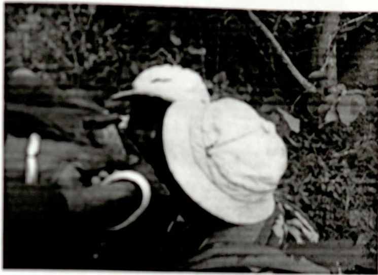
የጊኝና የገዳይ ቤተሰቦች በአንድ ሾርቃ /ቅል/ ሲጠጡ

ፀግሞ ለተራረፀ ደግሞ ከሽግግሮቻቸው አንዱ የተወጠረውን የወተት አንጀት በጦር እንዲበጠስ ያደረጋል። ከዚያ በኋላ ተለምዶ እንዲሳሳው ይደረጋል። የአንጀቱ መወጠር በሁለቱ ወገኖች መካከል ተከስቶ የገበሬውን ውጥረት ግላፍ ሲሆን፤ በጦር መበጠሱ ደግሞ የውጥረቱን መርገብና መብስ የጊያላይ ነው። በመተጠል ሽግግሮቻቸው የተጠበሰውን ሥጋና የማሽላ ገንፎውን ወላጅ ደርባልቃሉ። ባለጋራ የገበሬትገፍ