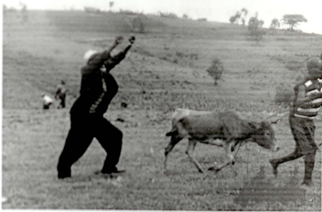
ኮፕርት እሻ ጥጥ ጸሻ የመቀበሪያ ከብት ሲሰጡ

በድር ገዢ ስድር ስፍራ/ እና አሁንም /በዘመነ ኢ.ሀ.አ.ዲ.ግ/ በቆላው አካባቢ የገደለ ወደ ኮፕርት ጣላባቶች/ ጋር እንደሚገባ ቀደም ብለን አይተናል። ለከተማ ቀረብ ያሉትና ደጋው አካባቢ ያሉት ደግሞ የገደያ ወንጀሉን እንደረጁ አጸባቢውን ለፖሊስ ይሰጣሉ። ይሁን እንጂ የመቀበሪያ ከብት ፈጥሮ ከመላክ የሚዘገይ የለም። የገዳይ ሽማግሌዎች ችግሩን ችግራቸው አድርገው ለጊዜ ሽማግሌዎች ፋታ እንዲሟቸውና እንዲያረጋገጥላቸው በሚከተለው መልክ ይጠይቃሉ።