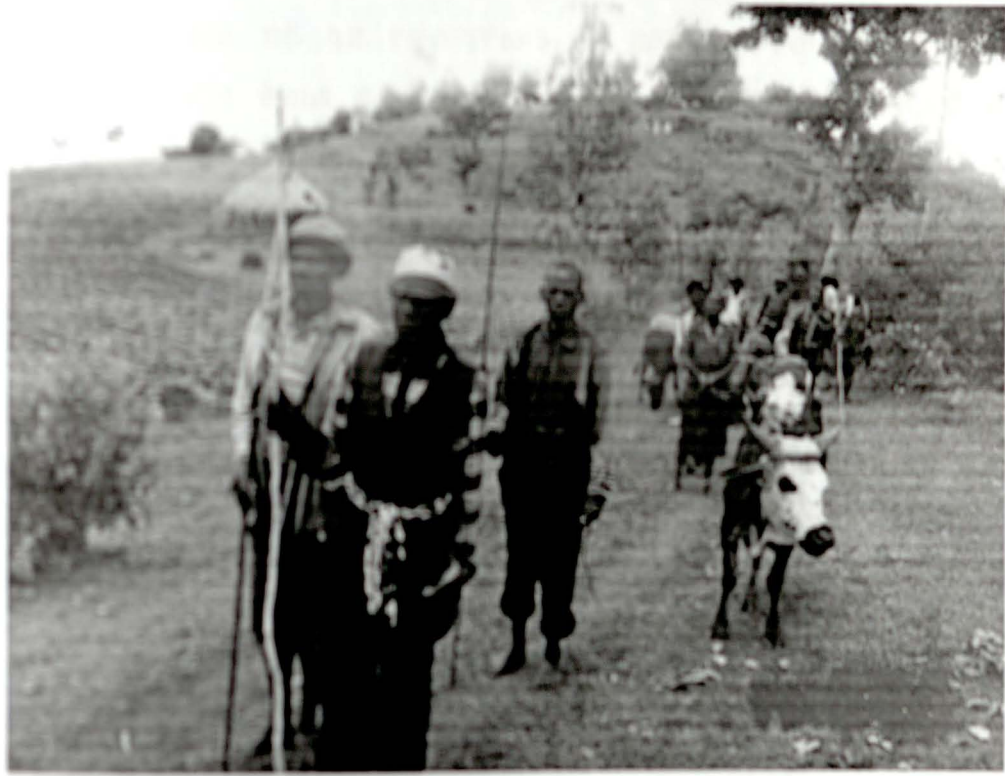
የልጃቸው እና የቀሪ ከባቶች የአሻ ክፍያ

የጊዜ ኮምፍት፡- ሸዎቤ መገዴ አጉዋ ወሽጋዲያና ጣዲያቦይ / የልጃችሁ ምትክ ይችትና ተተባብሩ።