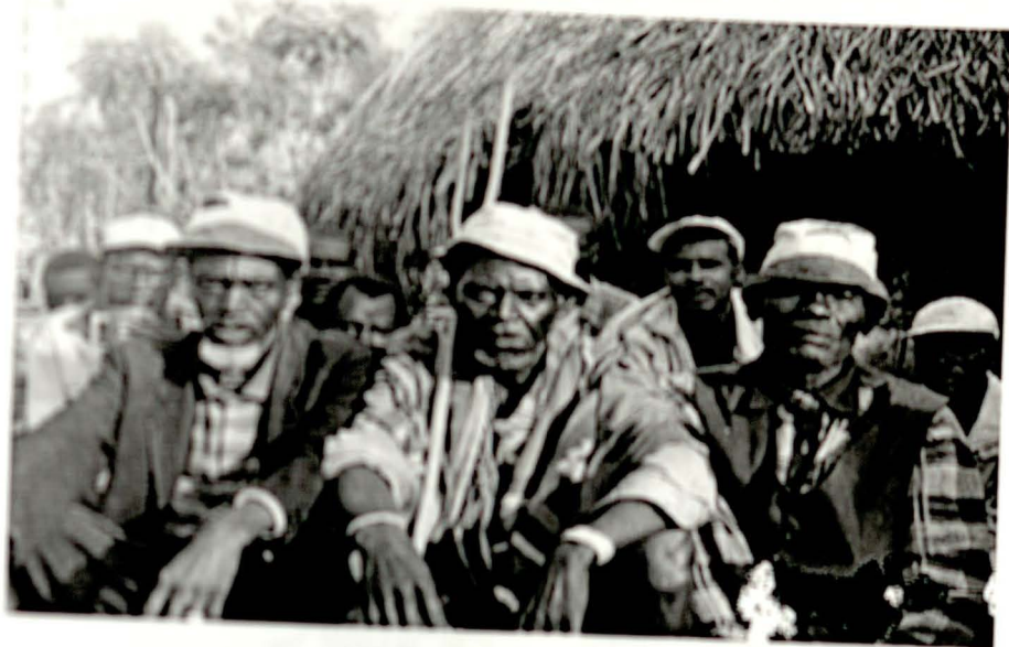
ከገራ ወደ ቀኝ ኮርሞ እሻ ጥጥ ጸሻ፣ ኮሞሩት እሻ ሲላ ሶሎ-ኮርይና ኮሞሩት እሻ ሲሚንቶ ሲማቻ

ሰለግተዳደርና ሰለግኝምን ነው። በቆላው ገዳይ ባላባት ቤት ከገባ ማንም አይነካውም።” 59 ይህንን አባባል ሌሎች ይጋራታል። “ባላባቶች ወደ ቆላው ነው ያሉት። እንደ ሰው ገድሎ ወደዚያ ቢሄድ ‘ደሙን እዚህ ይዞ መጣ’ ሰለግኝባል ከብት ቀጥቶ ጠ ትልቅ ገበጣ አጥቦ ነው የግጥነው። ባላባቶቹ ጋ ከገባ ደገሞ እሻን ከመክፈል ውጪ ማንም አይጠይቀውም።” 60 ከደርግ መንግሥት ወደተት በጊላ ጥቂት እካባቢዎች ለደጋው ክፍል/ ሰው የገደለ ሰው እጁን ለመገገሥት እየሰጠ ቀሪ ዘመዶቹ ደገሞ ባህላዊ የሆነውን እርቅ የእሻን ሥርዓት ይፈጽማሉ።