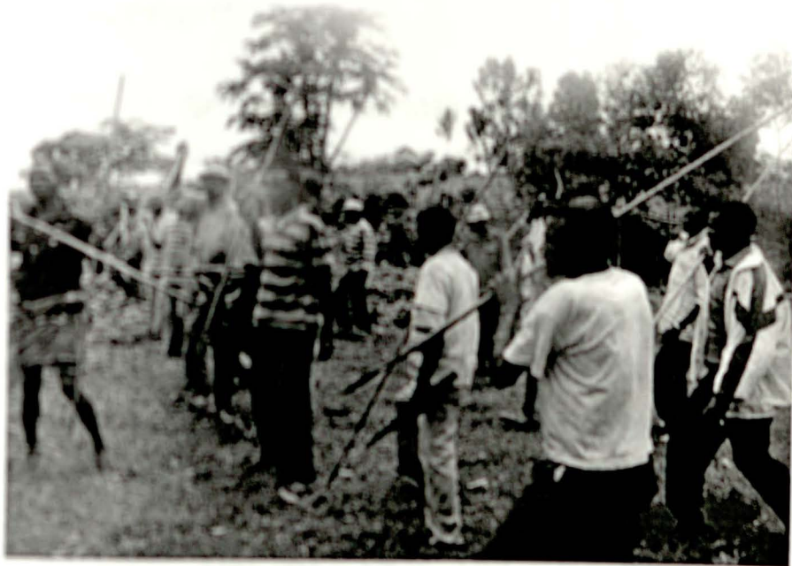
የግዢ ወገኖች ለበቀል ሲነሱ

ቀርቶ የጎሳዎች ጠባይ ይሆናል። ይህንን ጊዜ በድንገትም ይሁን አስቦ ሰው የገደለ ሰው በአጠቃላይ የሱ የሆኑ የጎሳው አባላት ራሳቸውንና ንብረታቸውን የማሸሸ፣ የማራቅና የመሰወር ሥራ ይሰራሉ። በግዢ ወገኖች የሚደርሰው ጥፋትና የበቀል እርምጃ የማይቀር ፈጣን መሆኑን ስለሚያውቁ የግሰጠንተኛ መልዕክቱ እጅግ በፍጥነትና በጥንቃቄ ይተላለፋል። ጥንቃቄው የግዢ ወገኖች ያገኙትን የገዳይ ወገን ሁሉ በጦር ወገተው፣ በገጅራ ቀጥቅጠው ደም ስለሚበተሉ ነው። በአገጽሩ የግዢ ጎሳዎች በፍጥነት እየተጠራሩ ወገኖቸው መውደቁንና መገደብን እንዲሁም የገዳይ ጎሳ ማንነት በመናገር አስቸኳይ የሆነ የበቀል ጦር ሰብቀው ወደ ገዳይ ወገኖች ለመሞግት ይጠራሉ። በእርሻ ቦታ፣ በገበያ ላይ ወይም በየትኛውም አካባቢ ያለ የጎሳው አባላት ለጥቃት እንዲሰባሰቡ መልዕክት ይተላለፋል። "አንድ ሰው አንድን ሰው ሲገድል ኮፕርቶቸው ከመገባታቸው በፊት የሰው ንብረት ይጨፈጨፋል። ሃያም ሰላሳም ከብት ዘርፎ እርጽ ቢሰጥ አይጠየቅም።" ስለዚህ የገዳይ አባት ካለ እሱ፣ አባት ከሌለው ሌላ የቅርብ ሰው ፈጥኖ ወደ አስታራቂ ሽግግሮች ይሄዳል። ከዚህም ልጅ ሰው እንደገደለና ከዚህም ጥፋት እንዲወጣቸውና የግዢ ወገኖች ከሚፈጽሙት የበቀል እርምጃ እንዲያድኗቸው፣ ጠቡም ከተለየ ጎሳ ከሆነ እልቂቱ እንዳይበረታ ፈጥነውም መሆኑን እንዲገቡላቸው ይለምናሉ።