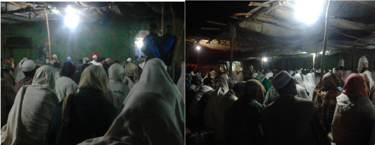
አባሪ ፎቶግራፍ 6: የሌሊቱ የዳዕዋ ስነ ስርአት በወንዶች ዳስ ውስጥ።