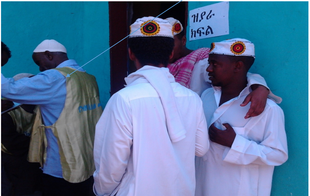
ምስል 1:- ወደ ዚያራ ክፍል ለመግባት የሚጠበቁ ምዕመናን የሚያሳይ ምስል።

በዚህ ሒደት ሁለት ምላሾችን ከአጠቃላይ ምልክታዩ ለማስተዋል ችያለሁ። የመጀመሪያው የአላሁን ታላቅነትና በሱ ፈቃድ ሰላም መሆናቸውን የሚገልጹ መላሾች ሲሆኑ በሁለተኛው መልክ ደግሞ በሼሆቹ በረከት ሰላምና ጤና እንዳገኙ የሚገልጹ መሆናቸውን ነው። ከዚህም በመነሳት የሼሆቹ መልካም ስራና በረከት ለኛ ህይወት ሰላምና ጤና መሆን መሰረት አለው የሚሉ ምዕመናን መኖራቸውን ለማስተዋል ችያለሁ።