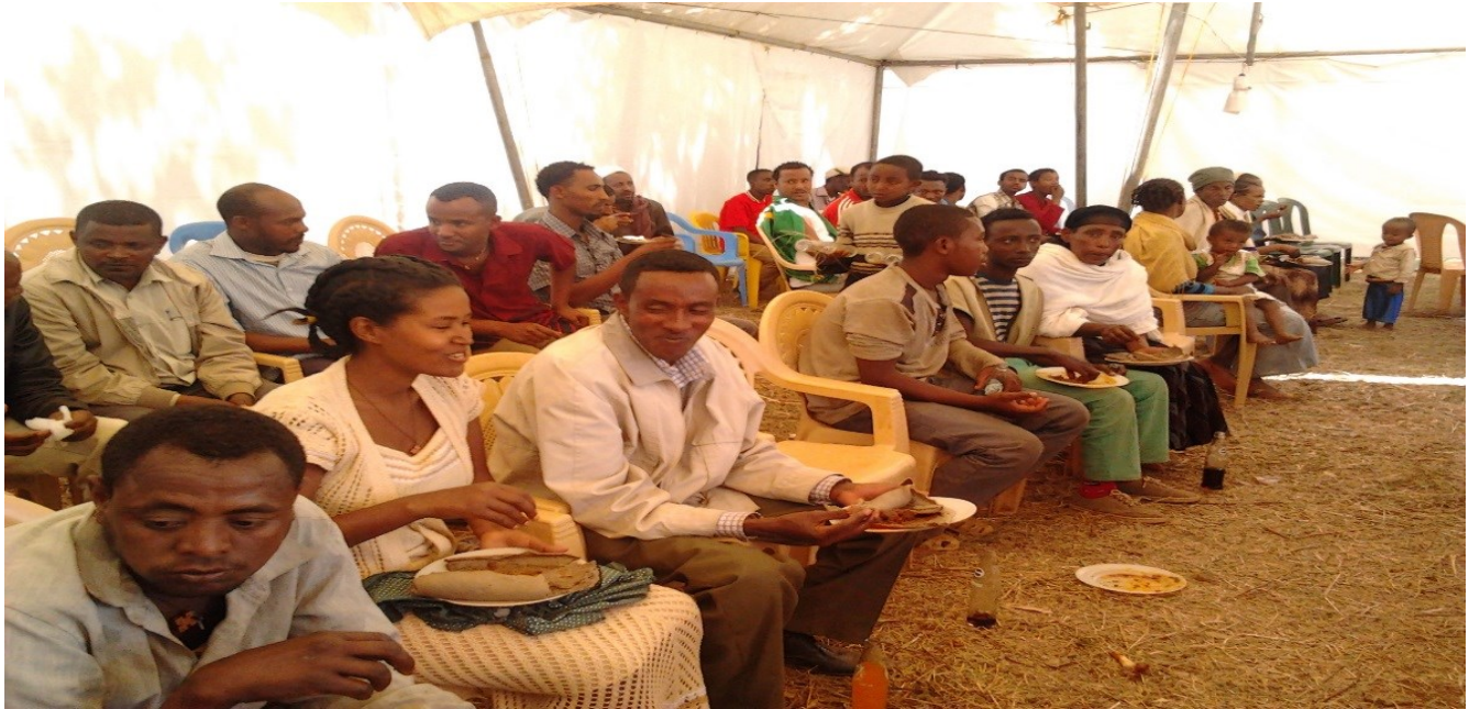
አባሪ ፎቶግራፍ 1፡ በክብረ በዓሉ ዕለት ምግብ በመመገብ ላይ የነበሩ የክርስትና እምነት ተከታዮች፤