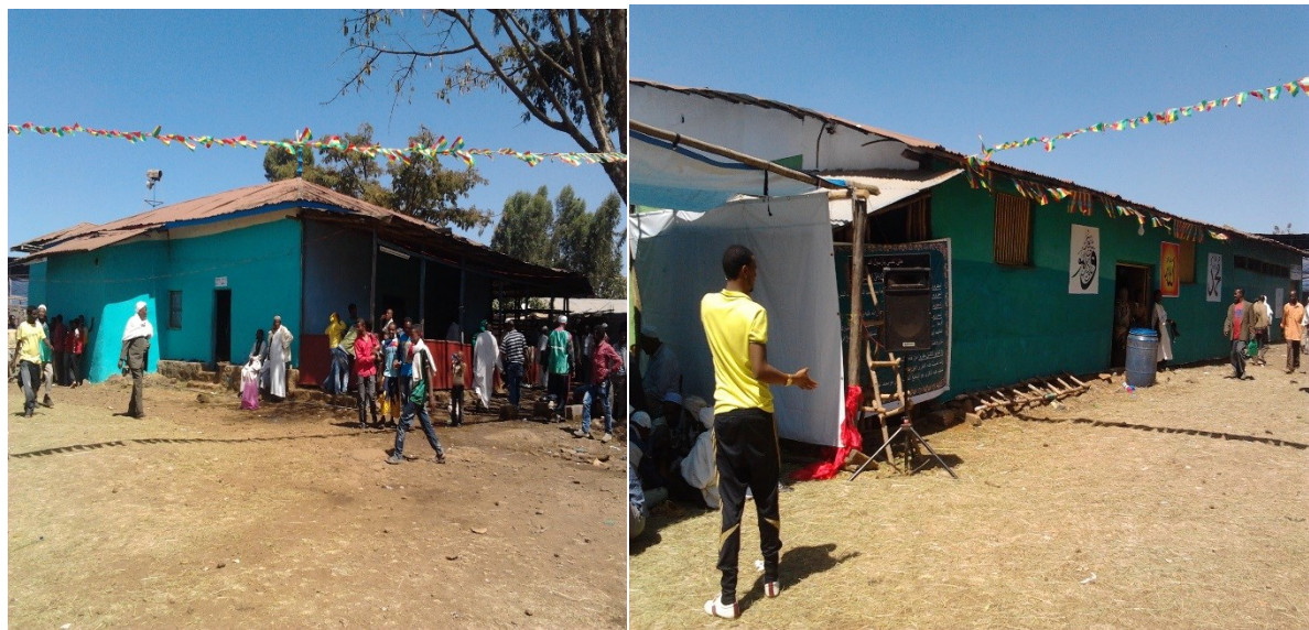
ምስል :- ከግራ ወደ ቀኝ በ1962 ዓ.ም ተሰራው የነሺህ ዳንግላ መስጅድ እና ለመውሊዱ ማክበሪያ የተሰራው አዳራሽ ከፊል ገጽታ

በማለት ነግረውኛል። ከነዚህ ገለጻ ለመረዳት እንደሚቻለው መስጅዱ የአሁኑን ቅርጽ ከመያዙ በፊት በትንሽ መስጅድ እንደተጀመረና በ1962 ዓ.ም የያሁኑን መስጅድ መሰራቱን ነው። የዚህ ጥናት አቅራቢም በጥናቱ ወቅት በምልክታ ለማስተዋል እንደቻለው በ1962 ዓ.ም ከተሰራው መስጅድ በተጨማሪ በቋሚነት የመውሊድን ክብረ በዓል ለማክበር የሚያገለግል አንድ ሰፊ አዳራሽ መገንባቱን ተመልክቷል። በተጨማሪም ከአቶ ኡስማን ሰኢዱ (የመውሊዱ ክብረ በዓል ሊቀ መንበር) ጋር በዕለቱ በተደረገ ቃለ ምልልስ አዳራሹ ከመውሊዱ ማክበሪያነት በተጨማሪ የረመዲን ወርን የተርሐዊ ሶላት መስገጃነት በመሆን እንደመስጅድ እንደሚያገለግል ለመረዳት ተችሏል።