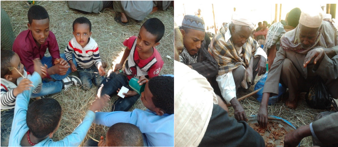
አባሪ ፎቶግራፍ 5: ከላይ የሚታዩት ምስሎች በወንዶች ዳስ ተሳታፊዎች ከእድሜ እኩያቸው ጋር ምግብ ሲመገቡ የሚያሳዩ ናቸው።