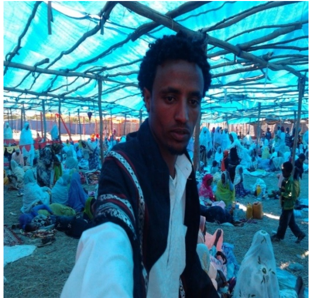
አባሪ ፎቶግራፍ 4: የሴቶች የጸሎት ማከናወኛ ዳስ (በስተግራ በኩል ከሚገኘው ግድግዳ ላይ የተወጠረው ነጭ ሼራ ምሽት ሴቶቹ ከመድረኩ የሚባለውን የመንዘት ማና ዳዕዋ ሁነት በቀጥታ በኤል.ሲ.ዲ ፕሮጀክተር አማካኝነት የሚከታተሉበት ነው።)