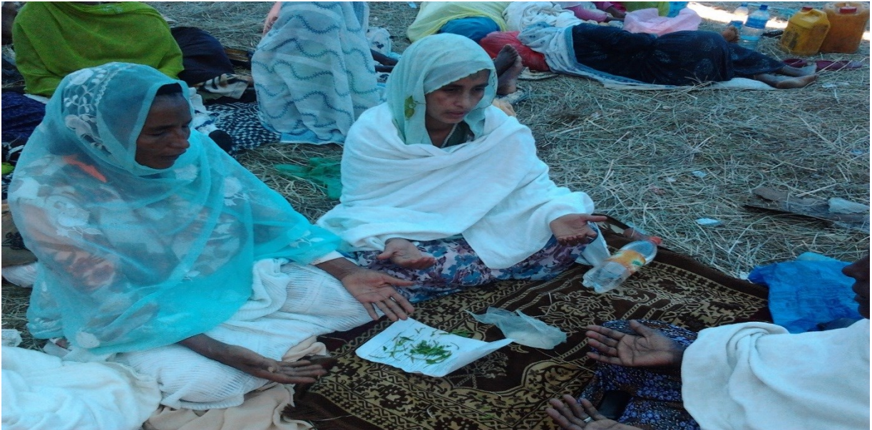
አባሪ ፎቶግራፍ 4: በሴቶች ዳስ ውስጥ ዳዕዋ ሲያደርጉና ሲመራረቁ፤