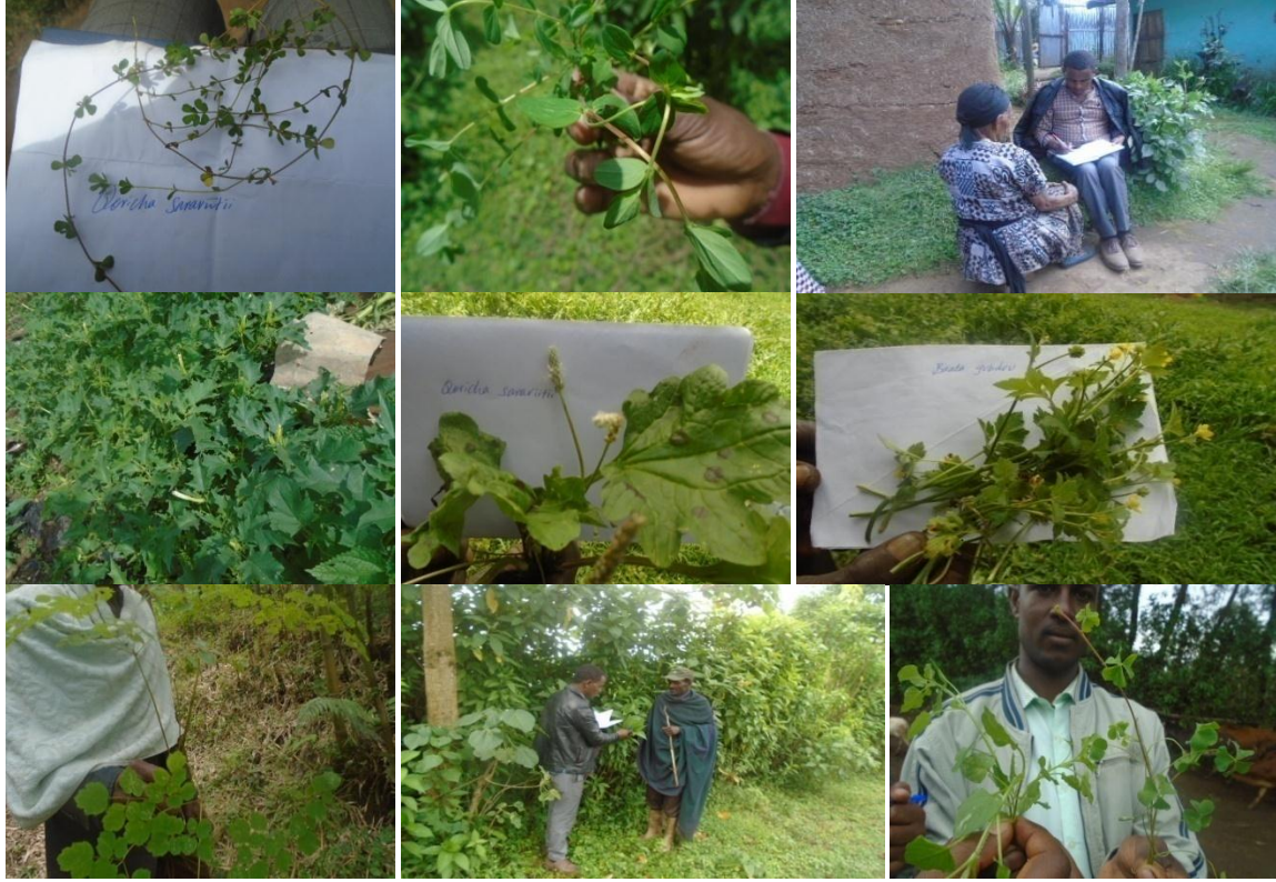
Suuraalee 6: Ganda Maaruu Gombootti 10/09/2011 Biqiloota qorichummaaf oolan, qorichahadhaa, asaangira, xibbiree, gubduu, abashurree, dhummuugaa, saamnee fa'aadha.