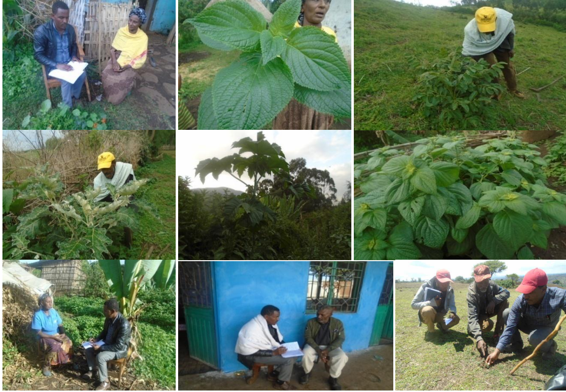
Suuraalee 7: M/gomboo, M/Jibaat, Shanan 01, taltalleefi Beerree 10/09/2011, 12/09/2011, 17/09/2011 Biqiloota qorichummaaf oolan: yeroo, qomonyoo, hiddii adii, qobboo, qoricha bofaa kan maqaansaa hin beekamne.