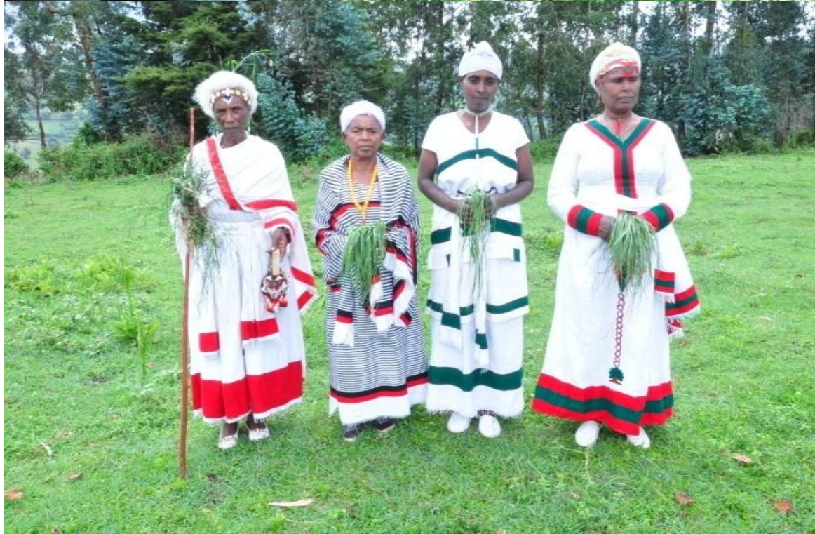
Suura 2 : Yeroo Irreechi Arfaasaa Aanaa Jibaat Tulluu Jibaat irratti gaggeeffamu Ebla 27/2011 kaafame agarsiisu.Coqorsi,alangaafi siiqqeen QA Oromooti.