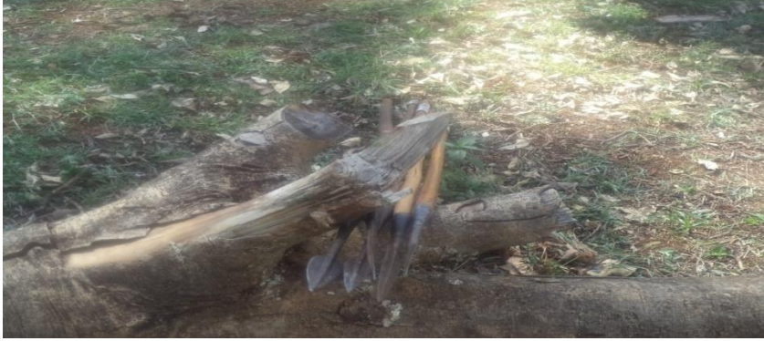
Suuraa4: Meeshaa aadaa aanaa jibaat 20/08/2011 aadaafi turizimii aanichaatii fudhatame.