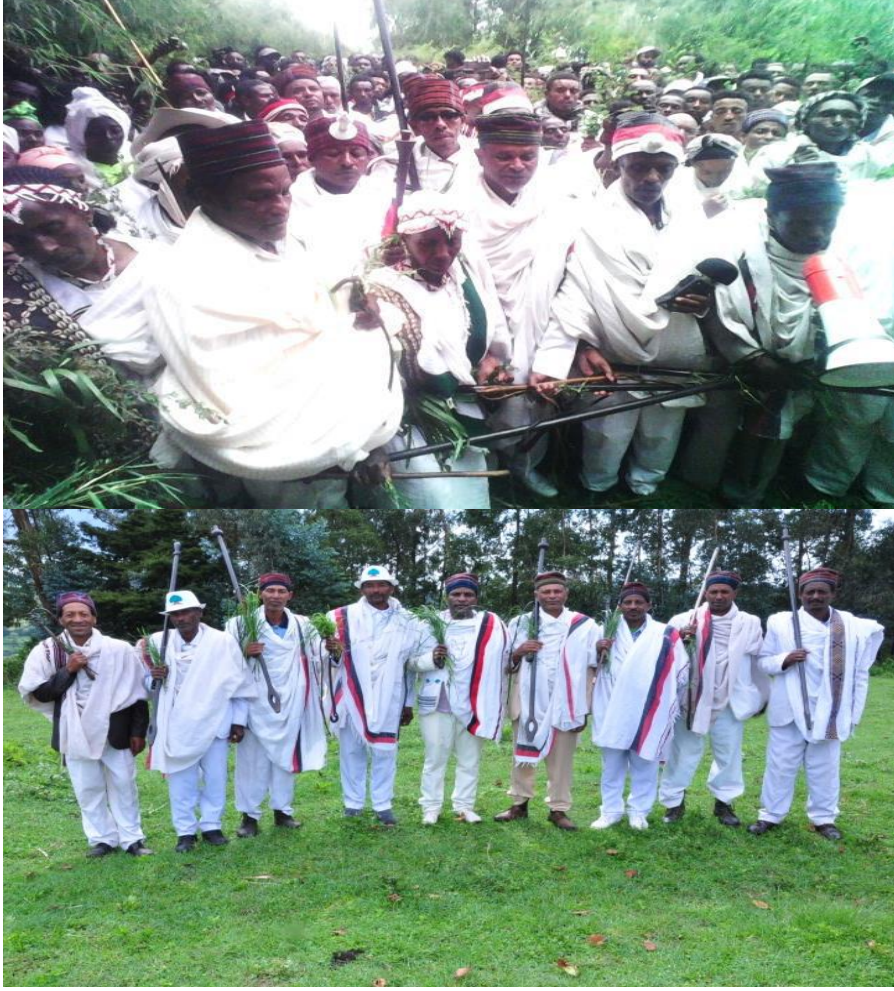
Suura 1: Yeroo Irreechi Arfaasaa Aanaa Jibaat abbootii gadaafi maanguddootaan Tulluu Jibaat irratti gaggeeffamu qorataadhaan Ebla 27/2011 waraabame agarsiisu.