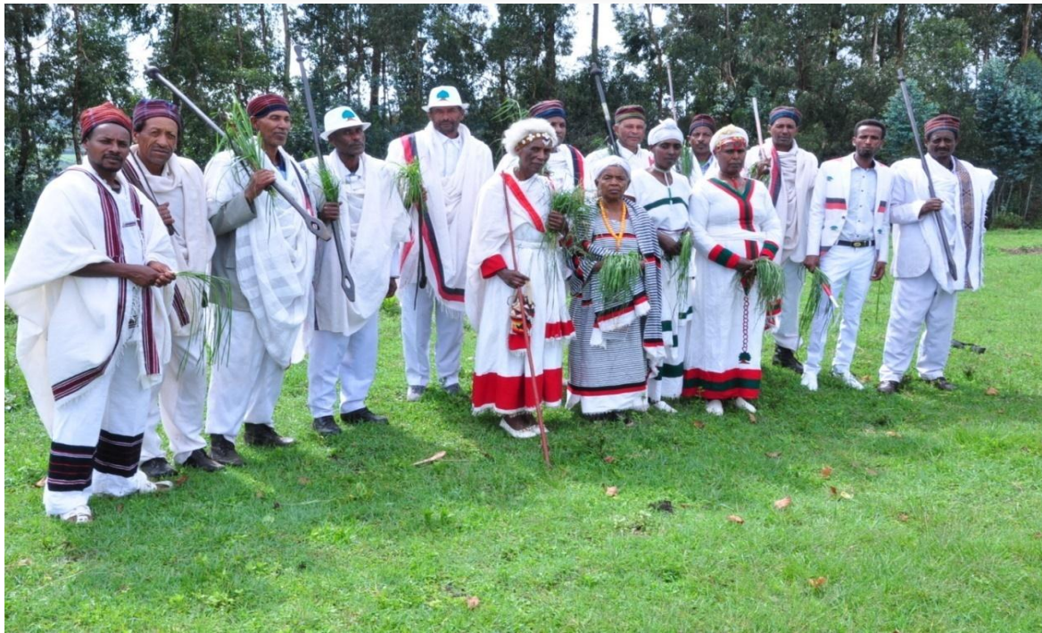
Suura 3 : Yeroo Irreechi Arfaasaa Aanaa Jibaat Tulluu Jibaat irratti gaggeeffamu qorataan Ebla 27/2011 kaafame agarsiisu. Eebbi Oromoo QAti.