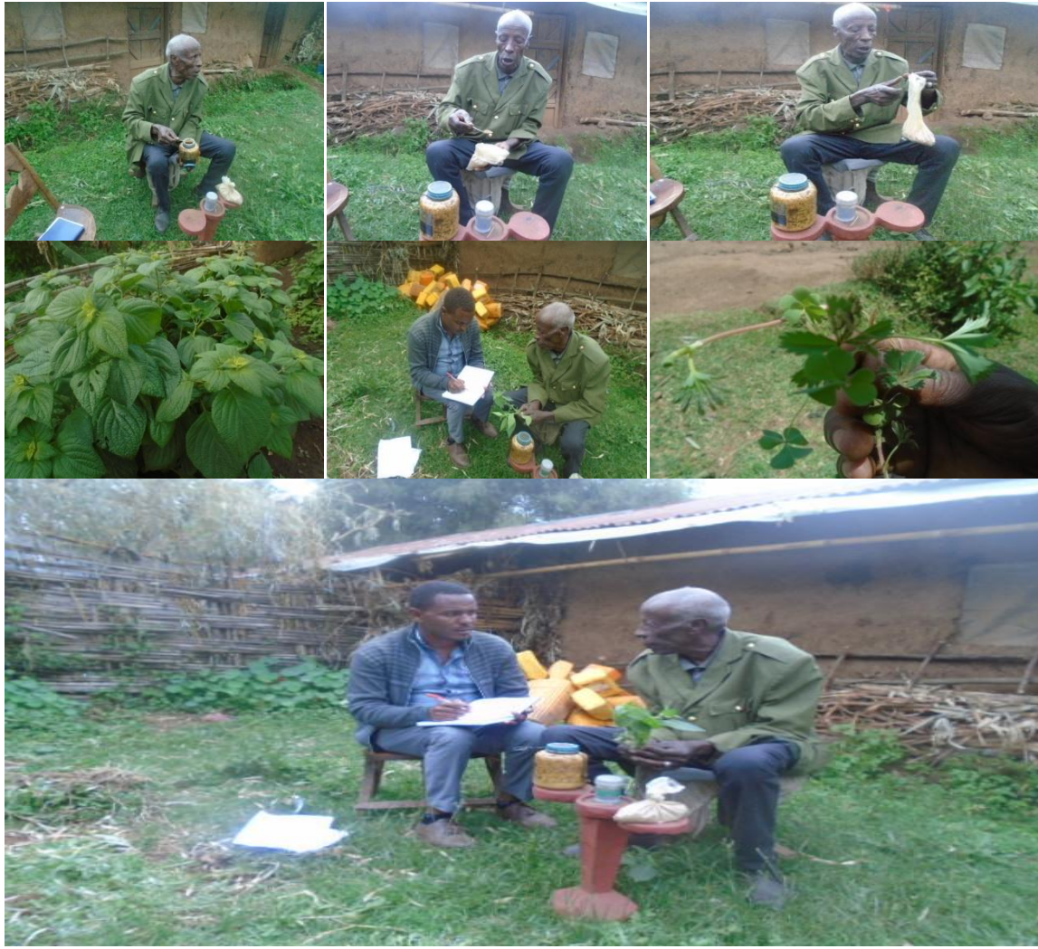
Suuraa 4: Ganda Shanan 01tti Obbo Taaddasaa Booraa, (05/09/2011) akkamitti qorichi aadaa akka walitti guuramee hojjetamuufi fudhatamu yeroo natti himanu.