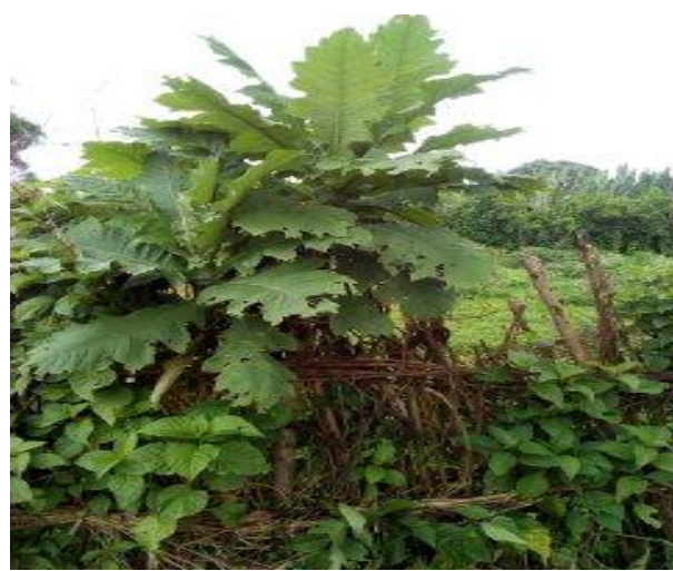
Suuraalee 9: Ganda Maaruu Jibaat 16/11/2011 Biqiloota qorichummaaf oolan:aannannoo, bosoqa, caraanaa, ceekaa, dhummuugaa ani kaase.