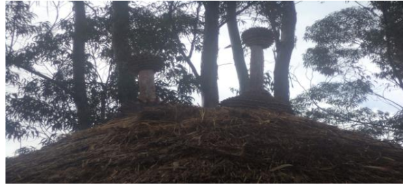
Suuraalee7: Bakkeewwan hawwatoofi mana qaalluu 20/08/2011 aadaafi Turizimii aanichaatii fudhatamani.