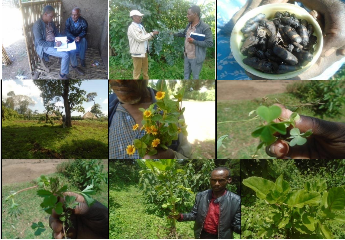
Suuraalee 5: Ganda Maaruu Jibaatiifi Maaruu Kombolchoo 18/08/2011fi 03/09/2011 Biqilootaafi bineensota qorichummaaf oolan:baargamoo, boombii gammoojjii, bakkanniisa, gororsaa, yaatuu sinbiraa, bal'oo, bosoqqee fa'aadha.