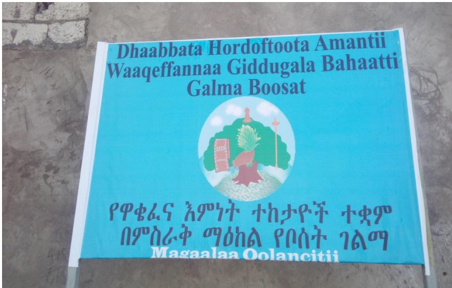
Barreeffama Iddoo Galma Boosat ibsu-Magaalaa Olancitii 15/8/2013