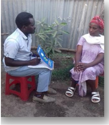
Suuraa Aadde Urgoo Badhaasoo