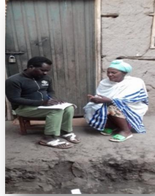
Suuraa Aadde Dammee Roobaa