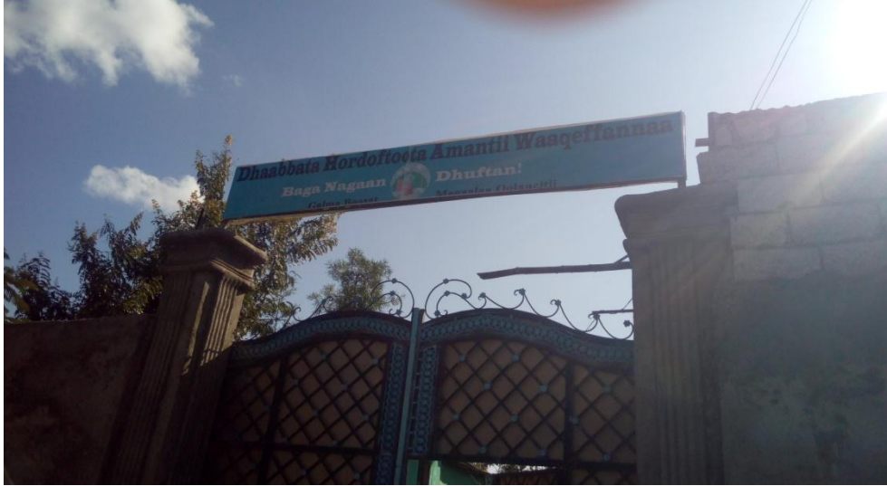
Galma Amantii Waqeffannaa Boosat-Magaalaa Olancitii 15/8/2013